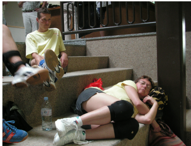
Nach mehreren Matches.... oder doch vorher ? ....

Wenn Sie « Die Familie im Garten » unterstützen möchten