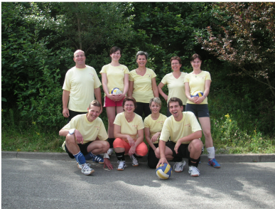
Das Team der „Familie im Garten“ beim Volleyball-Turnier der freiburgischen Sozialinstitutionen, Juni 2007